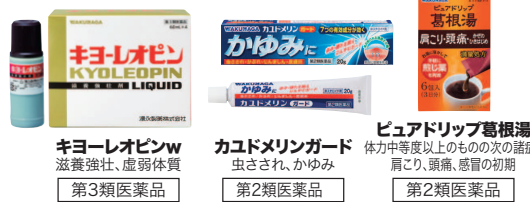
キョーレオピンw 滋養強壮、虚弱体質 第3類医薬品

●時間：9:30~11:30、12:30~15:30 ご希望の方に、試供品コーナーの薬剤師がご説明します。