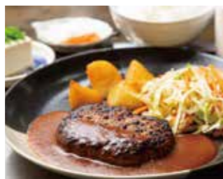
ごはん屋さん花亭 八千代町 安芸高田市八千代町下根1395-1 0826-52-3451