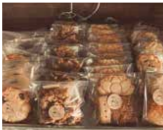
Reanka 菓子工房 八千代町 安芸高田市八千代町向山1096