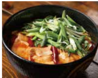
うどん・そば 権兵衛 美土里町 安芸高田市美土里町本郷14627 神楽門前湯治村内/0826-54-0888