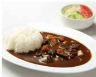
向原農村交流館やすらぎ 向原町 安芸高田市向原町長田22-1 0826-46-3987