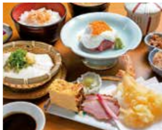
お食事処 谷屋 高宮町 安芸高田市高宮町原田1787-1 たかみや湯の森内/0826-59-0059