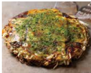
お好み焼 たけちゃん 高宮町 安芸高田市高宮町佐々部前川964-2 パストラル内/0826-57-1701