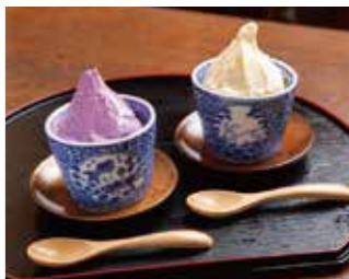
ばあばの蔵かふえ 高宮町 安芸高田市高宮町原田478 電話なし