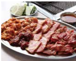
焼肉 りき食堂 甲田町 安芸高田市甲田町下小原1388-1 0826-45-3140