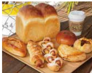
ROUTE 54 BAKERY 吉田町 安芸高田市吉田町山手1049-1 0826-43-2131