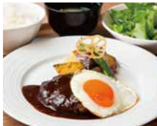
ファーマーズレストラン安芸高田 吉田町 安芸高田市吉田町山手1005-1 0826-47-2580