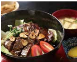
MIDORI 八千代町 安芸高田市八千代町勝田1326-1 0826-52-2279