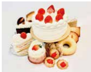
Pâtisserie Lien 吉田町 安芸高田市吉田町常友477-5 0826-48-1451