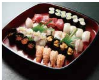
なかむら寿司 甲田町 安芸高田市甲田町高田原1424 0826-45-2149