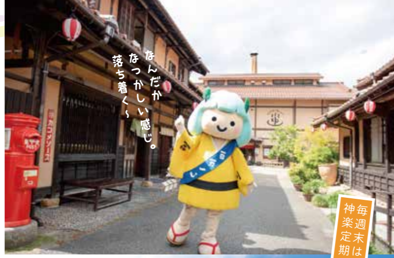
↑施設全体がレトロ感のする造り。

美味しい地元ジビエ料理が楽しめる、お食事処、お土産物店のほか、天然ラドン温泉や、神楽鑑賞施設まである、ドライブでも宿泊でも丁度いい、山のリゾート。年代問わず多くの方が訪れる人気スポットです。