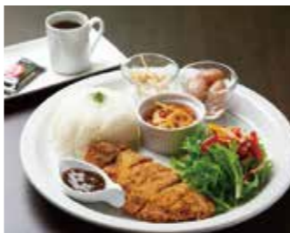
珈琲たまちゃん農園 吉田町 安芸高田市吉田町山手1733-1 0826-43-1781