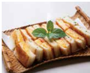
茶房いなだ 吉田町 安芸高田市吉田町吉田1012-2 0826-42-0220