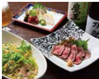
CORINTEI 吉田町 安芸高田市吉田町吉田3779-1 0826-42-2415