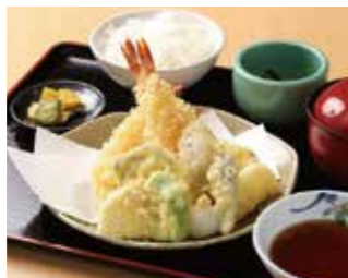
お食事処 土師さくら亭 八千代町 安芸高田市八千代町土師1194-1 0826-52-2841