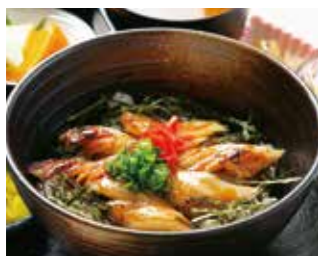
八千代カントリークラブ 八千代町 安芸高田市八千代町佐々井979-1 0826-52-2121