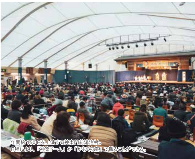
年間約150日上演する神楽門前湯治村。日程により、「神楽ドーム」か「かむくら座」で観ることができる。

全国各地に、さまざまな形の神楽が伝えられているなかで、安芸高田市の神楽は、出雲流神楽が石見神楽を経て、江戸期にこの地域に伝えられたと考えられています。その過程で、九州の八幡系の神楽や高千穂神楽・備中神楽、さらに中国山地帯に古くから伝わる農民信仰などの影響を受け、現在の形態になったといわれています。その特徴は演劇性が強いという点で、極めて大衆的で、のびのびした伝統芸能に発展しました。