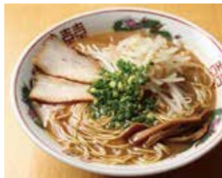
らーめん ござき 吉田町 安芸高田市吉田町上入江1925-2 090-1353-2057