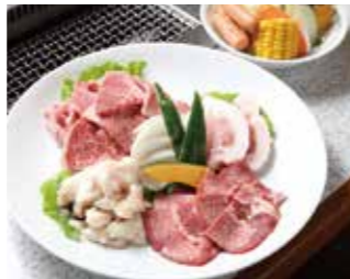
焼肉 一心 吉田町 安芸高田市吉田町吉田786-1 0826-42-3539