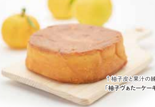
↑柚子皮と果汁の練り込まれた、「柚子グアターケーキ」。

生産者の人たちの想いに惹かれ、ここにしかない特別な柚子に惹かれたファンを全国に持つ、川根柚子。今では入荷待ちや即完売といった商品も続出する人気のブランド柚子です。