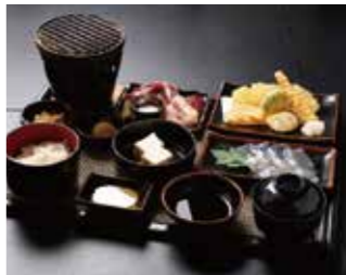
お食事処 ふくすけ 美土里町 安芸高田市美土里町本郷14627 神楽門前湯治村内/0826-54-0888