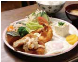
喫茶 ジョイフル 向原町 安芸高田市向原町長田3785 0826-46-2966