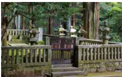
もうりもととなり 毛利元就の墓

毛利元就(1497-1571)は毛利弘元の次男として誕生した。兄興元とその子、幸松丸の死去により家督を継ぐ。生涯、幾多の合戦をくりぬけ、安芸の国人領主毛利氏を一代で西日本最大の戦国大名にのし上げた。