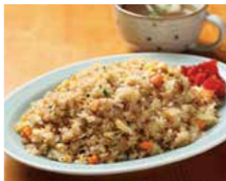
きらく 甲田町 安芸高田市甲田町深瀬809-1 0826-45-2871