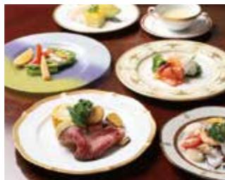
珈琲庵 舞 八千代町 安芸高田市八千代町佐々井96-1 0826-52-2627