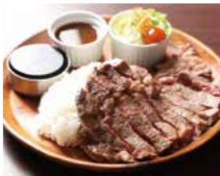
8〇8cafe 吉田町 安芸高田市吉田町常友1269-2 090-2806-5808