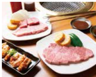
大福食堂 吉田町 安芸高田市吉田町常友1179-2 0826-42-0143