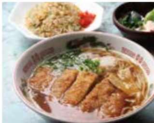
お食事と喫茶 KADO 吉田町 安芸高田市吉田町桂37-1 0826-43-1519