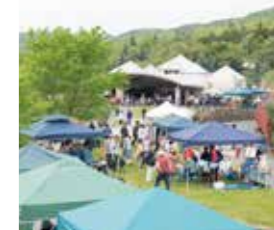
↑アートまつりin向原の様子

地元野菜・特産品販売だけでなく食堂「せせら」もあります。春には150店舗を超えるアートやフードなど様々な出店で賑わう県下でも有数のイベント『アートまつりin向原』、夏はアユつかみどり体験が出来る『わんぱくフェア』など、季節にあわせて様々なイベントを開催。