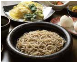
エコミュージアム川根 高宮町 安芸高田市高宮町川根1973 0826-58-0001