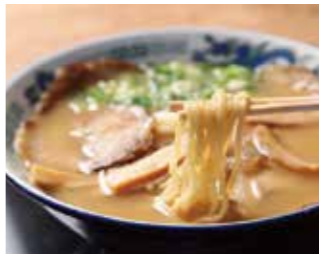
ながいきラーメン食堂 美土里町 安芸高田市美土里町横田331-1 道の駅北の関宿内/0826-57-1657