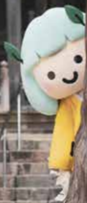
たかたん 里山を守る童子(鬼の子ども) (安芸高田市の公式マスコットキャラクター)

旅先で地元の人たちとの会話を楽しむと、いつの間にかその地に愛着が湧いて嬉しい気持ちになってきませんか？ 訪れる人を優しく歓迎する安芸高田市の人の優しさに触れる旅へ出掛けてみませんか。