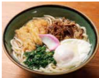
里の味 松や 向原町 安芸高田市向原町戸島96-1 0826-46-3848