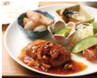
カフェ オリーブ 吉田町 安芸高田市吉田町吉田3904-1 0826-42-2226