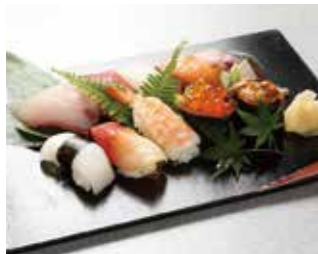
寿司ぐるめ あきんど 吉田町 安芸高田市吉田町吉田752-3 0826-42-1205