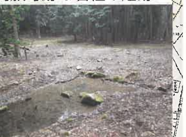
⑦満願寺跡の石組の池跡