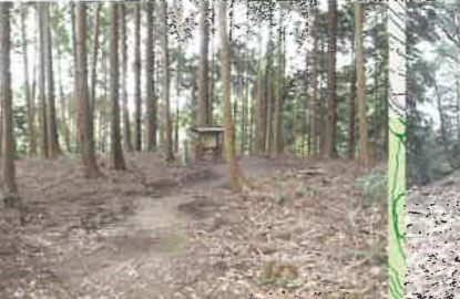
⑤姫の丸(百万一心石伝承地)