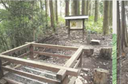
④釣井の壇の井戸跡