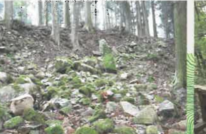
③三の丸下通路の石垣跡