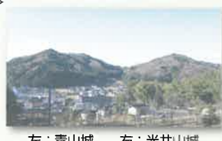
左：青山城 右：光井山城

郡山合戦時に風越山城を本陣とした尼子氏が郡山城に対峙して築いた陣城。両城とも4ヶ月間の使用とは思えない広大な郭群が全山に渡り築かれている。