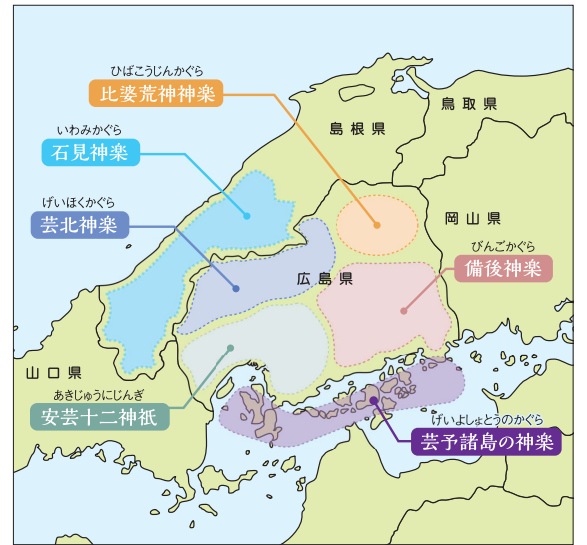
※参考文献：三村 泰臣「広島県の神楽探訪」南々社

広島県と島根県西部の石見地域には、あわせて約440の神楽団および神楽社中があるとされていますが、それぞれの舞いやお囃子の特徴を比べながら鑑賞していただくことで、神楽の奥深さや魅力を感じていただけるのではないかと思います。