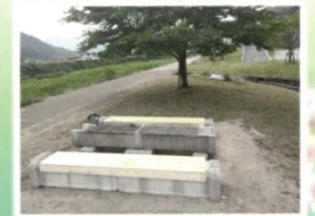
☆バーベキューコーナー 4人用BBQテーブル: 1000円 8人用BBQテーブル: 1600円 (安芸高田市外の方 300円増し)