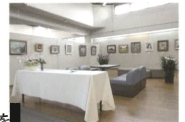
☆アート作家による作品を 月替わりで展示しています