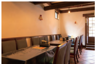
軽食・喫茶 【キッチン蔵】