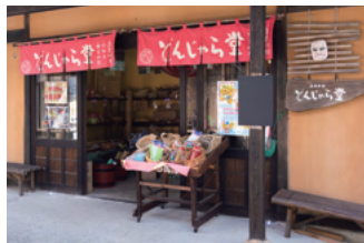
おもちゃ【どんじやら堂】