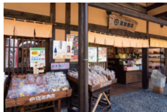
おみやげ処【道面商店】