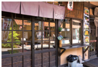
団子・甘党 【ひなや】