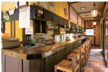
うどん・そば 【権兵衛】

一番人気の「夜又うどん」は、唐辛子の効いた、うま辛の特製スープに豚肉を乗せ特産の青ネギがたっぷり乗った逸品です。ぜひ、ご賞味ください。