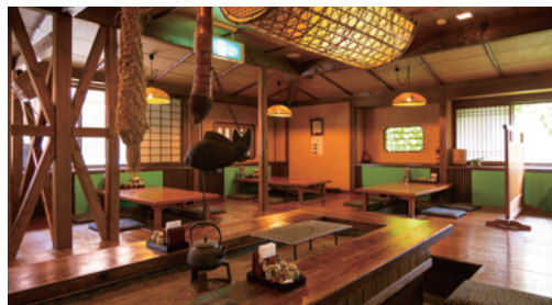
お食事処 【ふくすけ】

神楽門前湯治村には、「お食事処 ふくすけ」をはじめ、様々なお店が通りに軒を連ねています。 地元の新鮮な野菜や自家製豆腐を使った料理など山里の美味・珍味をお気軽にお楽しみいただけます。