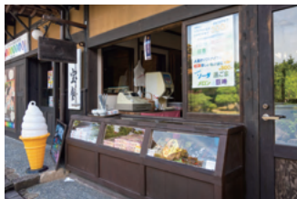
もち・和菓子【宝餅】