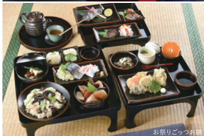
お祭りごっつお膳