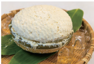
自家製豆腐【福助トーフ店】