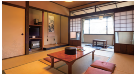
【山や】【里や】 【やまや別館】