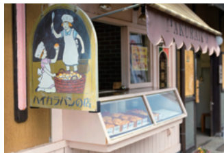
ハイカラバンの店【舶来堂】