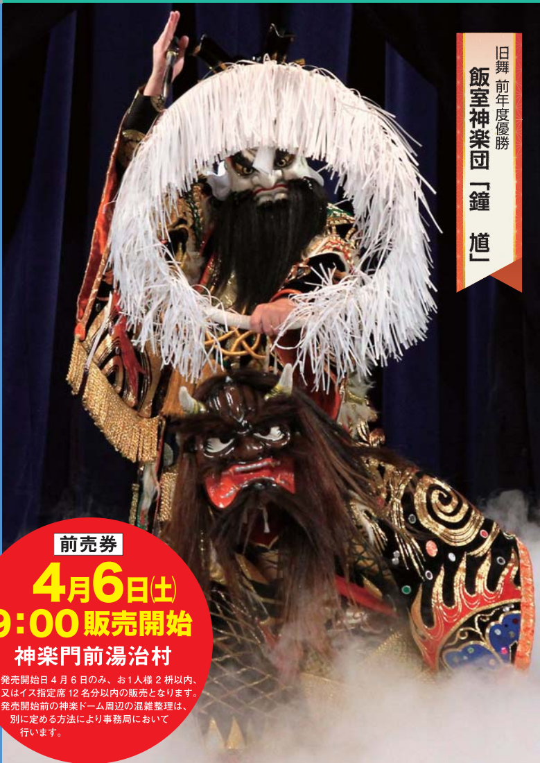
旧舞前年度優勝 飯室神楽団「鍾馗」