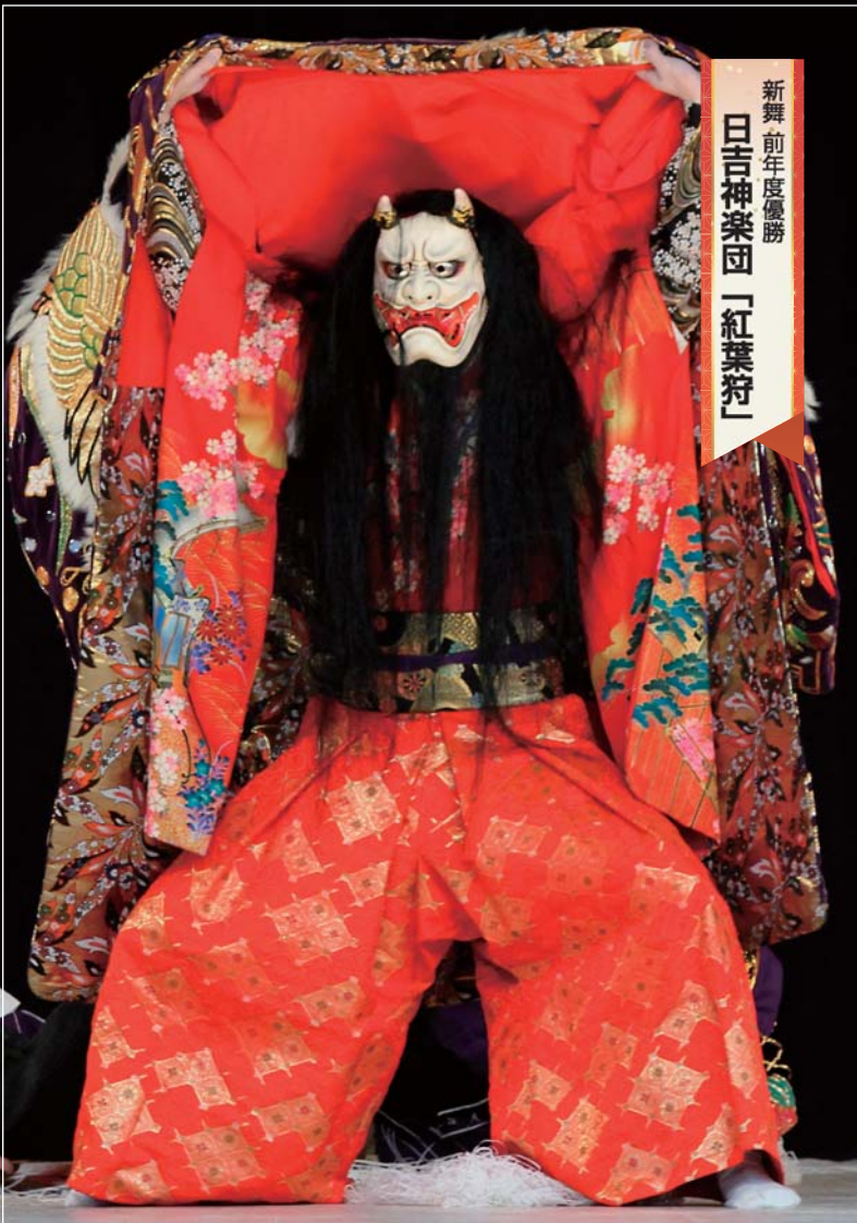
新舞前年度優勝 日吉神楽団「紅葉狩」